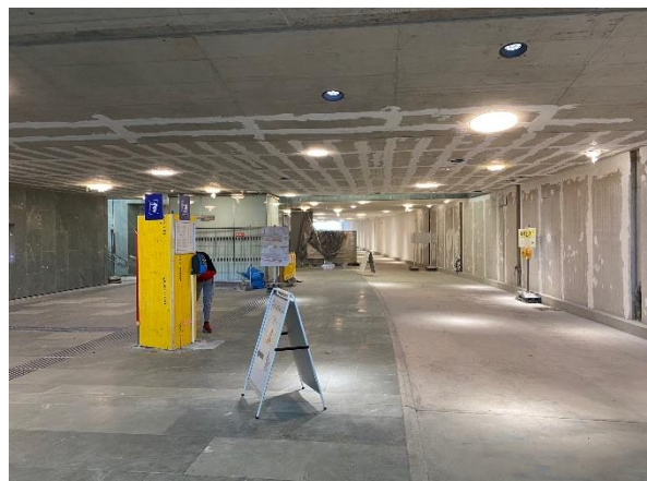
Links geht's zu den Gleisen, rechts ist die Spur für den Radverkehr.

Die Österreicher wissen auch, wie man menschenfreundliche Bahnhöfe baut. In Lienz (Osttirol) hat unsere Fraktionsgeschäftsführerin eine Unterführung entdeckt, durch die Radfahrer*innen in bequem den Bahnhof unterqueren und von der Radspur direkt aufs gewünschte Gleis gelangen. Natürlich per Lift . Wer vom Drauradweg den Bahnhof unterquert, landet auf der anderen Seite mitten in der Altstadt .